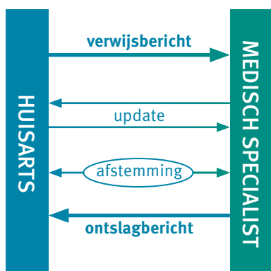
Figuur 2.1 Het HASP-model voor informatie-uitwisseling

sentijdse update belangrijk kan zijn voor de continuïteit van de zorgverlening in de tweede en de eerste lijn. Figuur 2.1 geeft een schematisch overzicht van de informatie-uitwisseling op de diverse momenten.